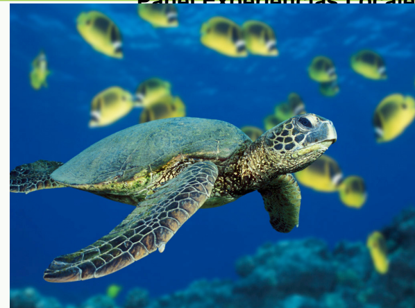
Panel Experiencias Locales